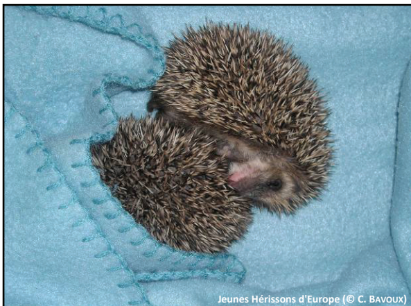
Jeunes Hérissons d'Europe

Malgré les soins prodigués, 209 des 535 animaux pris en charge n'ont pas survécu (39,1 %) : 36 ont dû être euthanasiés dès leur arrivée en raison de la gravité de leur état, 116 sont morts dans les premières 24 heures suivant leur accueil tandis que 57 autres sont morts les jours suivants, malgré les soins qui leur ont été prodigués. Faute de pouvoir être relâchés dans la nature, 1 Chien de prairie Cynomys ludovicianus a été gardé au centre et 1 Chevreuil européen Capreolous capreolus