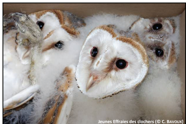
Jeunes Effraies des clochers

principalement à l'émancipation des jeunes qui sont alors très vulnérables car inexpérimentés, et aussi à l'augmentation importante du nombre de personnes présentes durant la saison estivale ce qui accroît bien entendu la probabilité de découverte d'un animal en détresse.